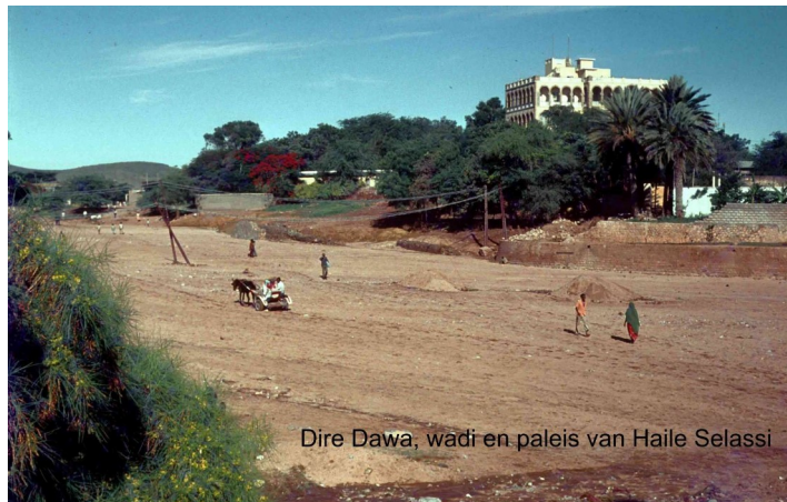
Dire Dawa, wadi en paleis van Haile Selassie

Dire Dawa wordt doormidden gesneden door een grote wadi. Er is één brug over, maar die is normaliter afgesloten voor auto's. De auto's moeten even verderop over de bedding rijden, die meestal droog is. Vanaf het station loopt een brede met bomen omzoomde weg die over de brug zich voortzet in het andere stadsdeel. De meeste belangrijke kantoren, winkels en hotels liggen in de buurt van het station, maar het busstation met veel drukte en winkeltjes daaromheen ligt op de andere oever.