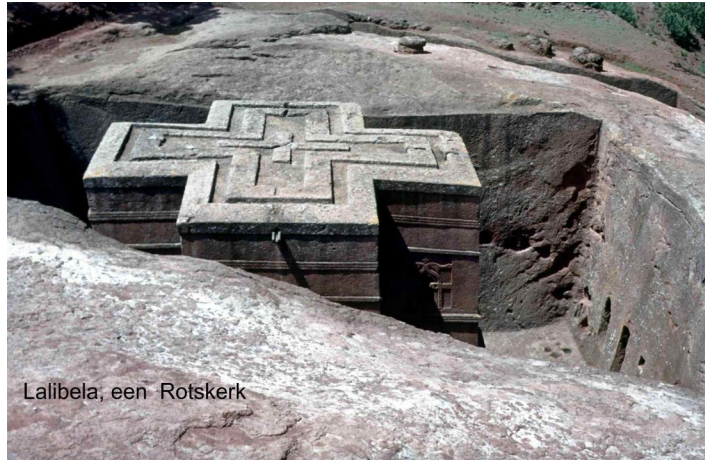
Lalibela, een Rotskerk

Lalibela zou een verbanningsoord kunnen zijn, zo afgelegen en onbereikbaar is het. Het dichtstbijzijnde ziekenhuis ligt op 180 kilometer afstand, bijna een dagreis wegens de terreinongesteldheid. Het toeval wil echter dat het een bijzondere religieuze betekenis heeft voor de Ethiopiërs die tot de koptische kerk behoren; en dat is het merendeel van de bevolking. In de dertiende eeuw heeft namelijk een Ethiopische koning, die Lalibela