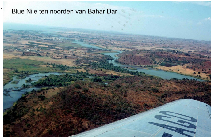
Blue Nile ten noorden van Bahar Dar

Terug in Addis stond er nota bene een auto van de National Tour Operator ( mijn reisbureau) klaar om mij naar de stad te brengen. Eindelijk eens service en waar voor je geld. Ik ben eerst naar